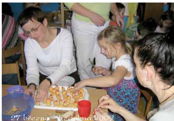
27 března - 5. dubna 2009