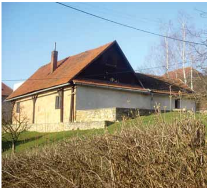
Pohled od SV