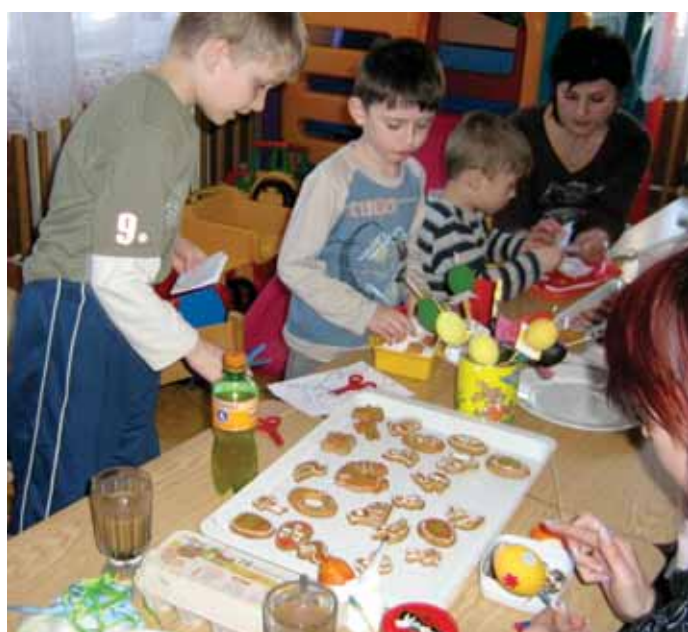
Z tvořivě velikonoční dílny s rodiči