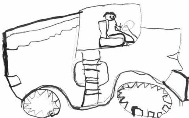
Jenda Sadilek 6 let