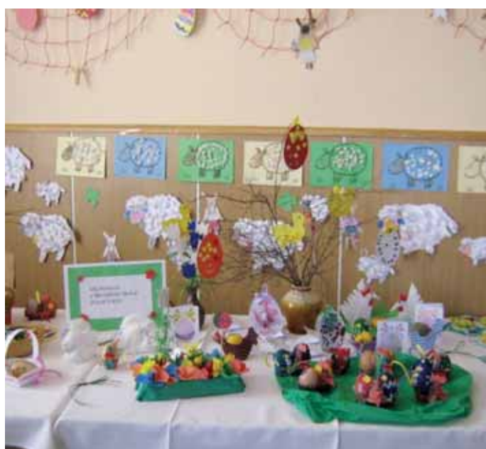
Velikonoční výstava výtvořů dětí z MŠ