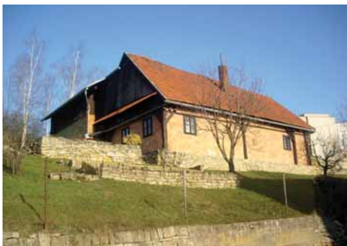
Pohled od JV