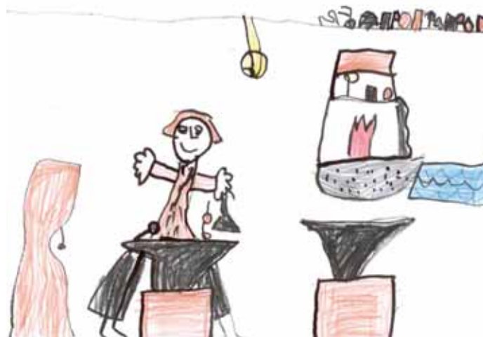
Danielka Pravcová 6 let

Co to vlastně znamená...? Dětem v mateřské škole vyprávění o řemeslech, zpívání písniček, říkanky a hry napoví jen polovinu, ale navštívit opravdové pracoviště, kde chlapi pracují s železem, se stroji, to je teprve něco! Děti vidají zemědělské stroje na vycházkách v průběhu celého roku, ale ty jen projedou okolo nás a jsou pryč. Podívat se však do dílny, kde se stroje opravují, vylézt do opravdového kombajnu, až do kabiny řidiče, to je zážitek pro kluky i holčičky daleko silnější. A proto jsme se vydali na návštěvu zemědělského družstva, také proto, že tam pracují naši tatínkové a dědečkové. Nejdříve jsme si prohlédli obrovská nová síla. „Obilí v nich ale ještě není. Až v létě. Zato v jednom z nich čeká kukuřice. Na Desné v míchárně z ní teprve udělají krmení pro zvířátka“.