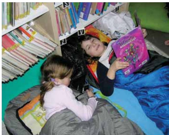
.....čteme na dobrou noc