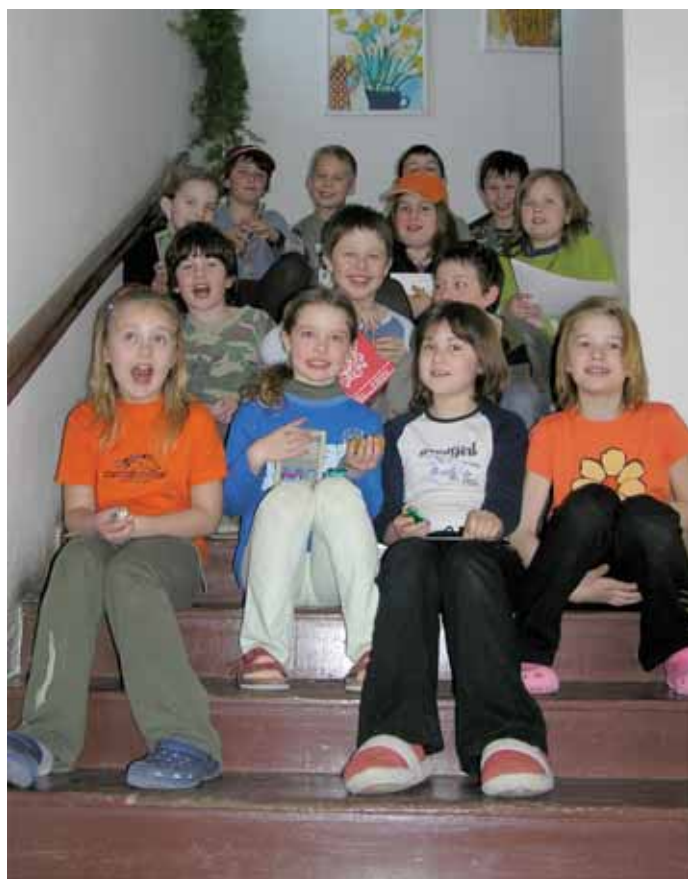
.....to jsou naši nocležníci