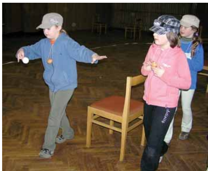
....."nemluvit, nekýchat" velké soustředění během bojů o poklad