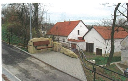
Odpočívadlo - Stežka