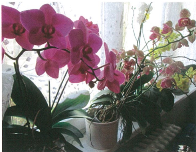
Vítězná fotografie 12/2013