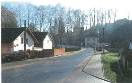
Pražský most - chodník