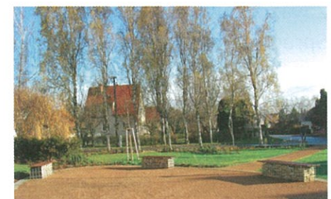
Park Rovinka - lavičky