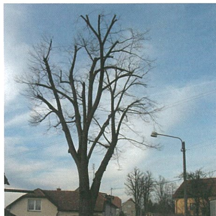
Pazucha - ošetřený strom