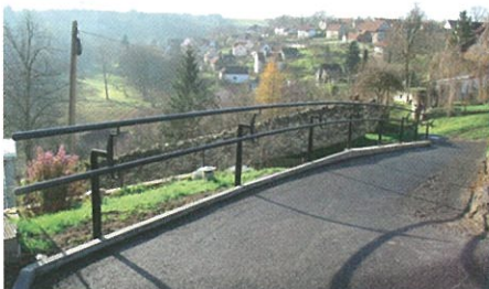
Stežka do Malvařic

Zajímavou a příjemnou epizodou letošního roku bylo naše účinkování v soutěži o vesnici roku. Asi pro každého je čas od času potřebné a užitečné ověřit si, jak působí na lidi a na své okolí. Naše obec to udělala formou účasti ve výše uvedené soutěži a zjištění, že jsme nepropadli, ale naopak obstáli, je více jak příjemná. Samozřejmě, že všechno není tak růžové, jak se na první pohled zdá, ale je také nezpochybnitelné, že naše obec o sobě dala vědět, že si můžeme místa, kde žijeme víc vážit a že máme být, na co hrdí.