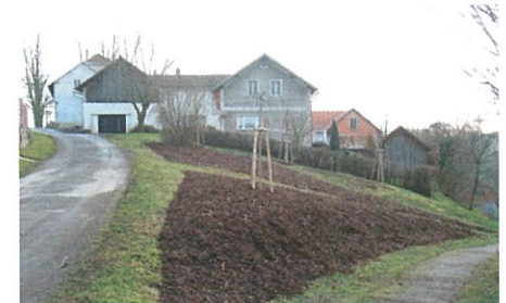
Pazucha - výsadba