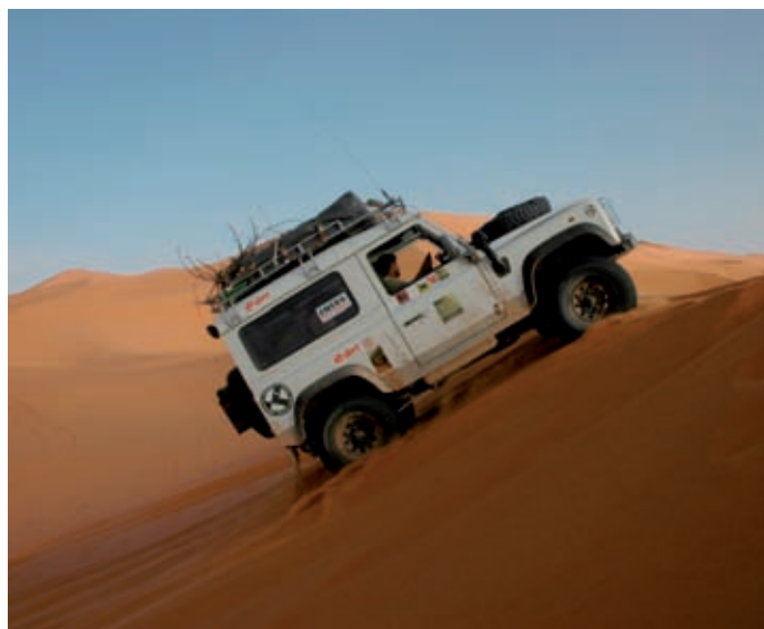
Jízda v dunách v Erg Chebbi