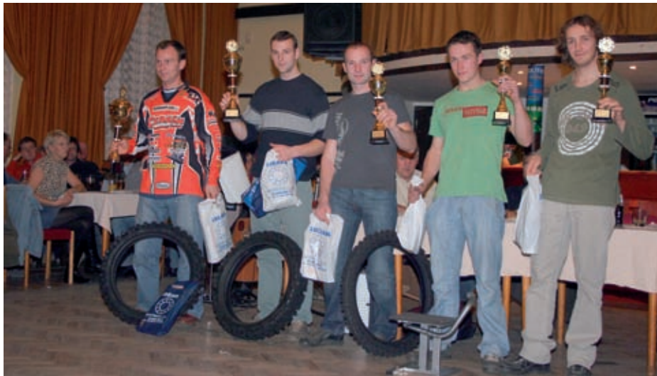
SMS Pce vyhlášení Černá za Bory