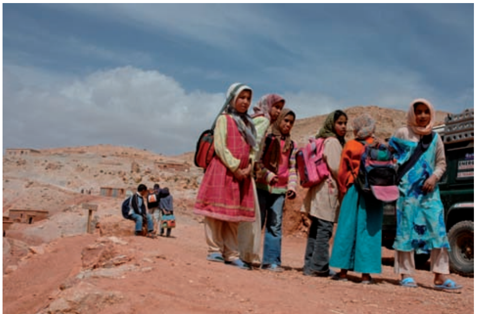
Školačky v horské vesnici