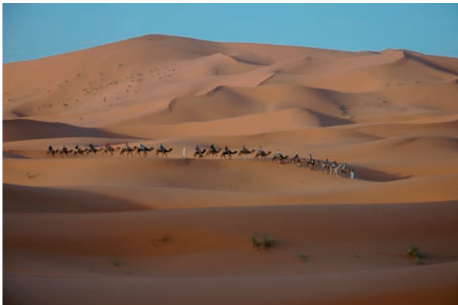
Karavana v Erg Chebbi