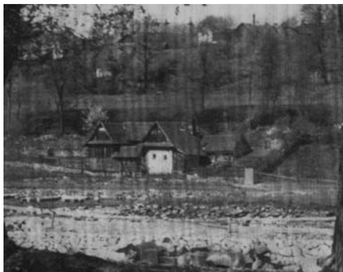
Chalupa č. 40

Farnost Dolní Újezd a KDU- ČSL Dolní a Horní Újezd pořádají