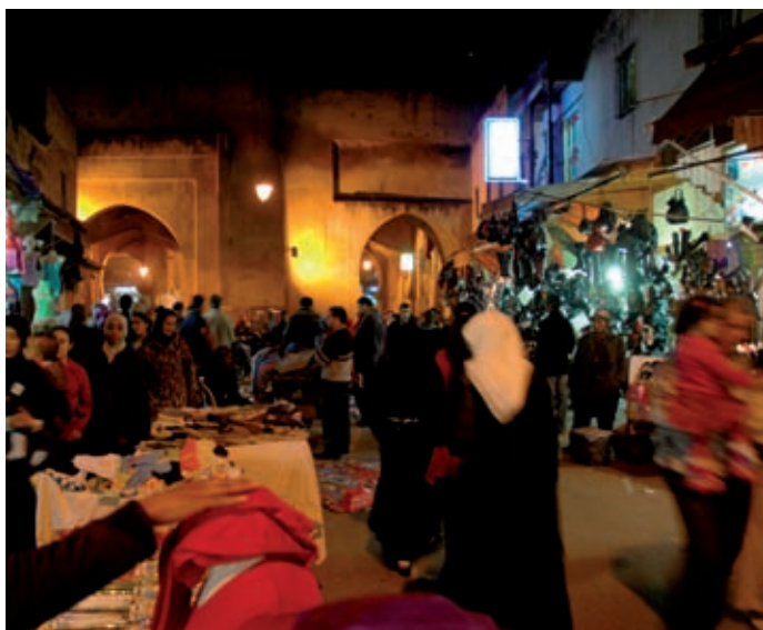
Medina ve Fesu