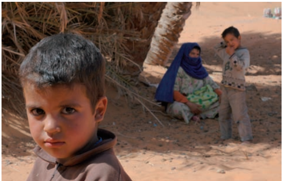
V Egr Chebbi